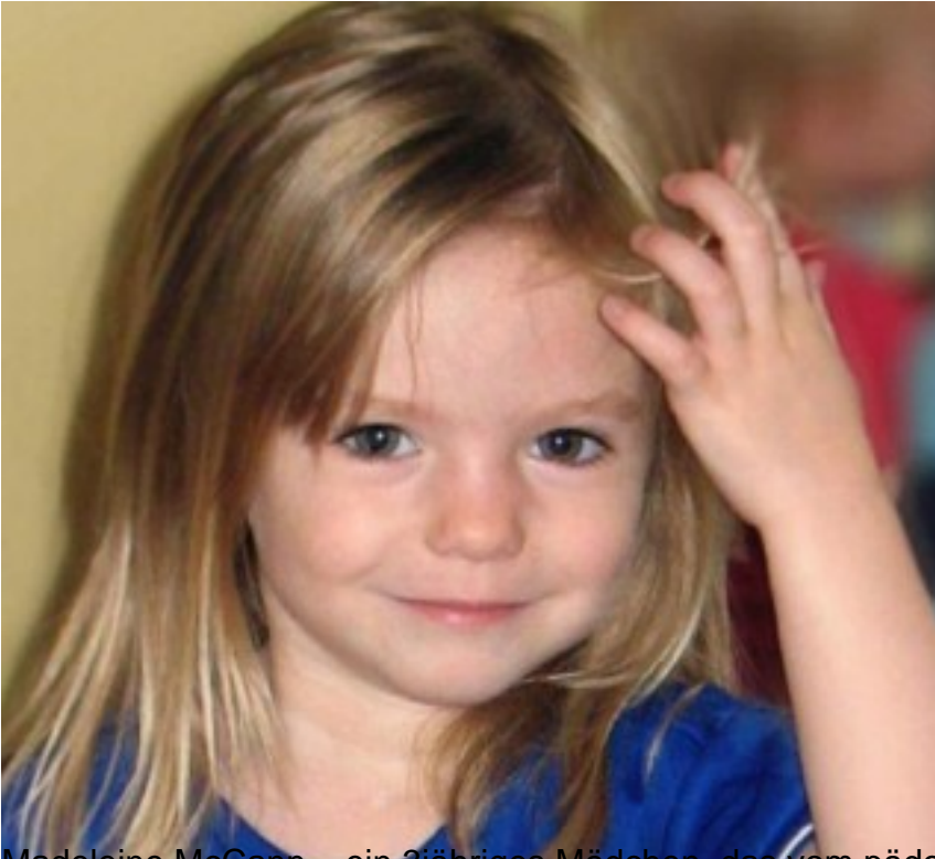
Madeleine McCann – ein 3jähriges Mädchen, das vom pädophilen Netzwerk entführt wurde

Das bedeutet in der Praxis, dass ein fetter, alter, dem Lebensende naher, krimineller, geisteskranker Psychopath ein leichtfertiges Urteil fällen kann und die Attacke einer Nation, den Beginn eines Krieges, einen Forscher oder Whistleblower schikanieren oder ermorden und ein Kind zerstückeln kann, nach dem er ihn oder sie entführen lassen und missbraucht hat.